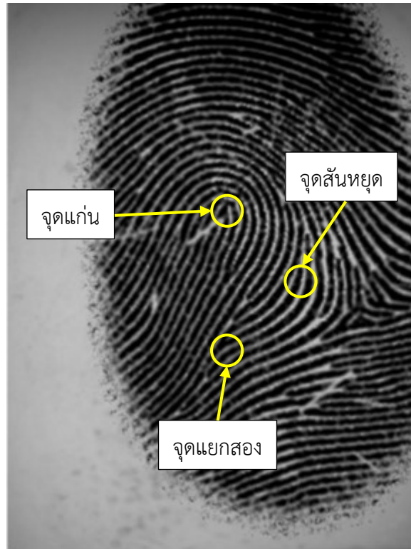
รูปที่ 2 ตัวอย่างจุดแก่น มินูเชียแบบแยกสอง และมินูเชียแบบสันหยุด ในภาพลายนิ้วมือ (ภาพลายนิ้วมือ สังเคราะห์จากฐานข้อมูลสาธารณะ FVC2004 DB4 [19])