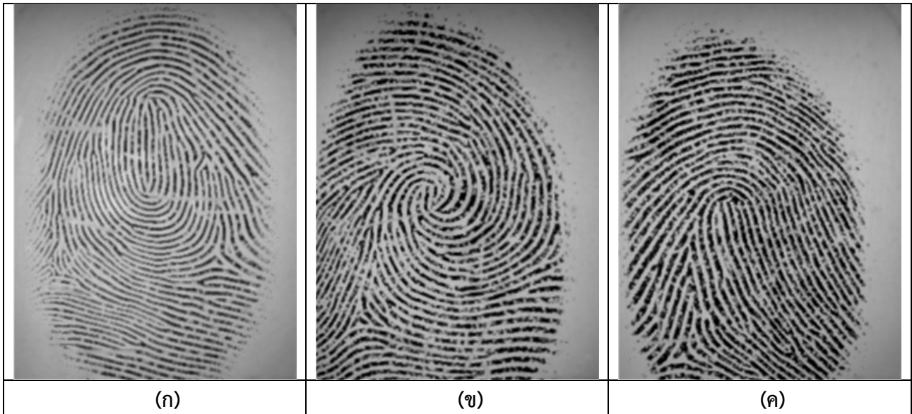
รูปที่ 3 ตัวอย่างภาพถ่ายลายนิ้วมือที่มีคุณภาพดี (ภาพถ่ายลายนิ้วมือสังเคราะห์จากฐานข้อมูลสาธารณะ FVC2004 DB4 [19])

ตัวอย่างของภาพถ่ายลายนิ้วมือที่มีคุณภาพต่ำดังแสดงในรูปที่ 4 ซึ่งลายนิ้วมือที่มีคุณภาพดีควรมีความชัดเจนทั้งภาพ แต่ในกรณีรูปที่ 4 (ก) บริเวณจุดแก่นชัดเจนแต่บางส่วนไม่ชัดเจน รูปที่ 4 (ข) บริเวณจุดแก่นไม่ชัดเจน แต่ส่วนอื่นชัดเจน และ รูปที่ 4 (ค) ไม่พบบริเวณจุดแก่นและบริเวณที่ชัดเจนมีจุดมึนเขียวน้อยมาก ทำให้มีโอกาสที่จะจับคู่ผิดพลาดมีสูงมาก ไม่สมควรป้อนเข้าระบบรู้จำลายนิ้วมือ